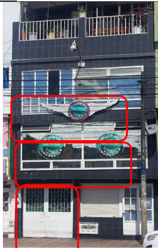
Fotografía No. 2: Visita de seguimiento al requerimiento al establecimiento DISCO BAR DEJAVU CROSOVER, efectuada el día 11/12/2015